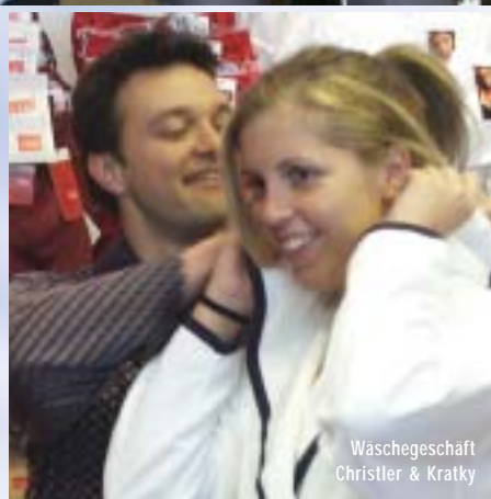
Wäschegeschäft Christler & Kratky