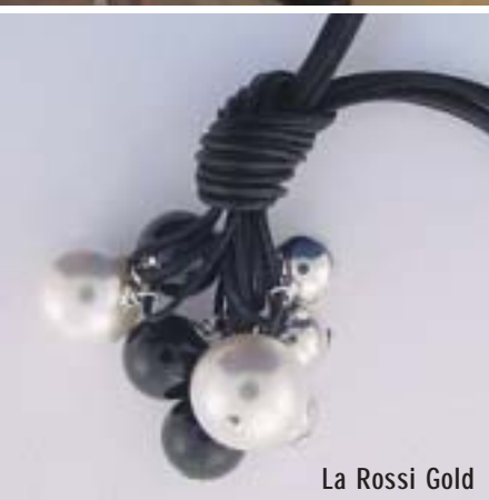
La Rossi Gold