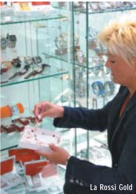
La Rossi Gold

Lieben Sie es klassisch oder gehen Sie gerne mit der Mode? Wie auch immer Sie sich stylen, bei La Rossi Gold finden Sie die optimale Schmuckergänzung zu Ihrem Outfit. Bei der reichen Auswahl an Gold- und Silberschmuck sowie Stahlschmuck mit und ohne Brillanten ist für jede Geldbörse etwas Passendes dabei. In angenehmem Ambiente können Sie in aller Ruhe Ihre Wahl treffen und den Schmuck auch gleich probieren. In den übersichtlich dekorierten Glasvitrinen können Sie nicht nur femininen Schmuck für gehobene Ansprüche, sondern auch Kinder- und Herrenschmuck bewundern. So finden Sie bei La Rossi Gold für jeden Anlass ein schönes Geschenk. Das freundliche Fachpersonal berät Sie gerne und informiert Sie auch über die neuesten Aktionen.