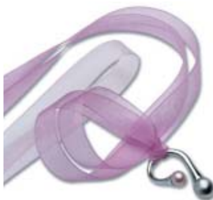
La Rossi Gold